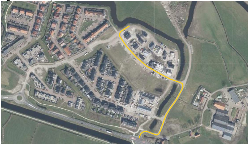
Figuur 3: transportroute

We voeren het werk heel lokaal in de wijk uit. Daardoor hoeven we geen wegen af te sluiten. Grond slaan we ten noorden van de toekomstige brug op. Voor het brengen en ophalen van materialen gebruiken we 1 route. Die ziet u in figuur 3.