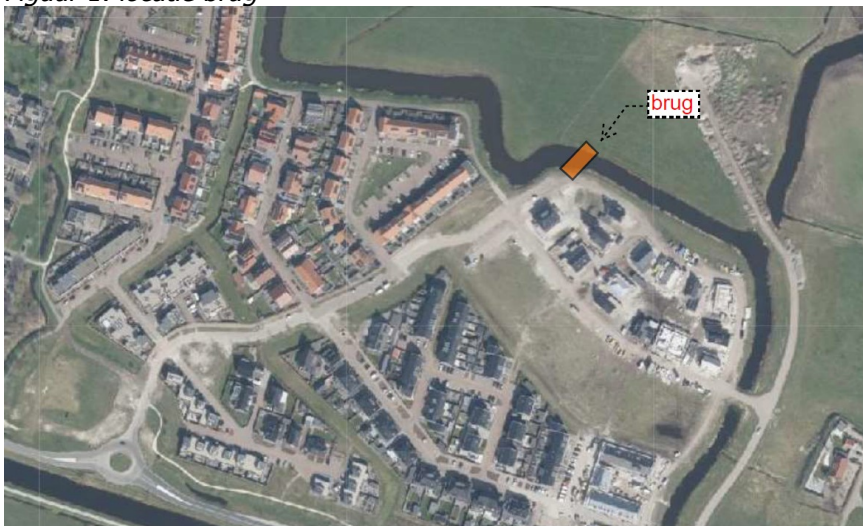
Figuur 1: locatie brug

In figuur 1 in deze brief ziet u op welke plek de brug komt.